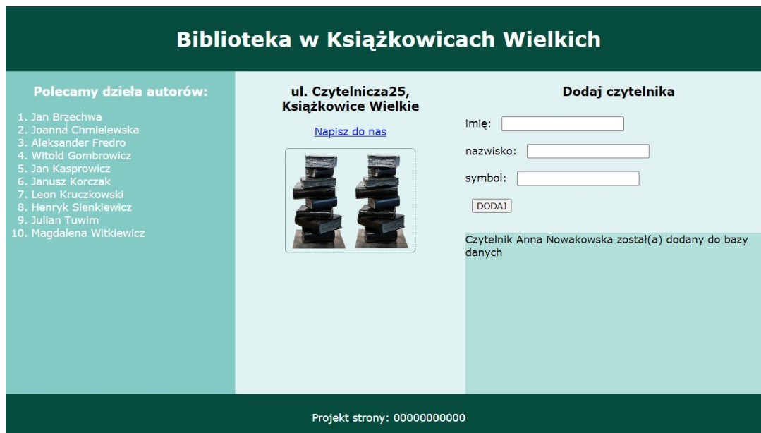
Obraz 2. Witryna internetowa. Po zatwierdzeniu danych z formularza